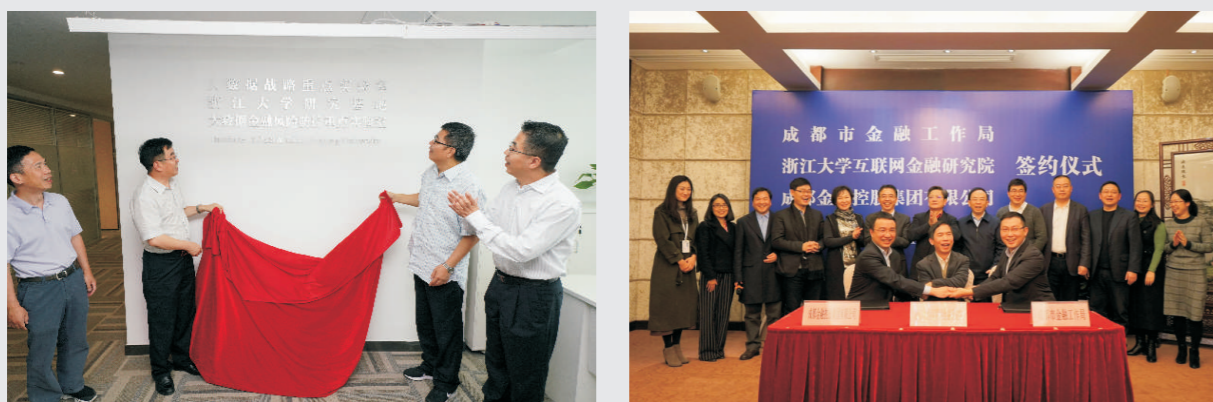
与贵阳市、上海市、成都市、杭州市、西安市人民政府合作